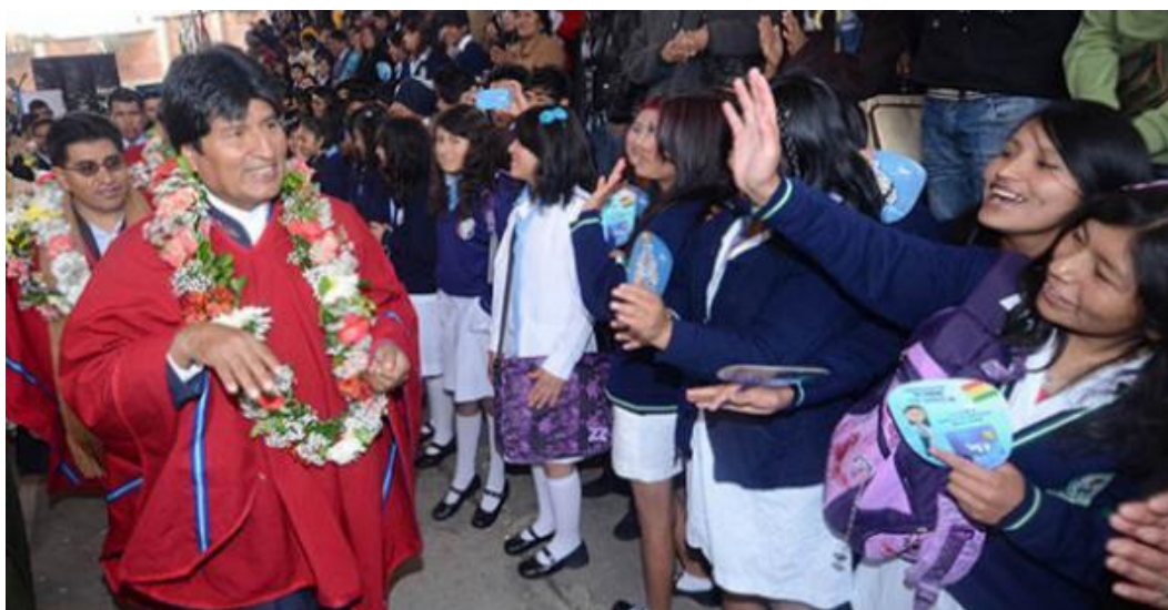
Así, envuelto en flores, se presenta el presidente Juan Evo Morales Ayma, ante las estudiantes el día de la inauguración del inicio de clases.

Cabe concluir este apartado, señalando que la histórica falta de presupuesto en realidad responde a una histórica falta de creatividad y transparencia, para operar los capitales de manera sistemática, transparente, solidaria y sostenidamente.