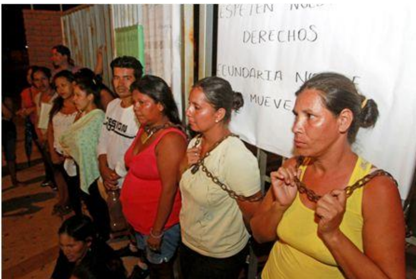
Madres se encadenaron como protesta a la expulsión a sus hijos e hijas tras la medida de 30 estudiantes por clase

así, no se puede retirar a estudiantes que ya la anterior gestión estuvieron en la misma unidad”, indicó.